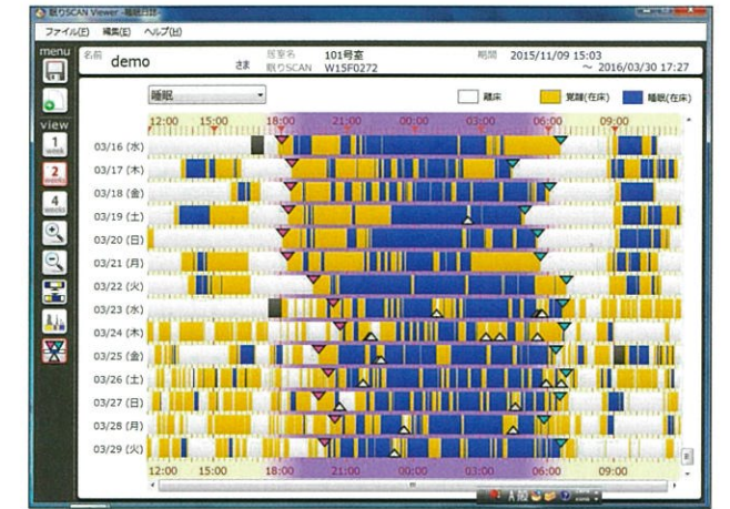
睡眠日誌2週間表示の画像